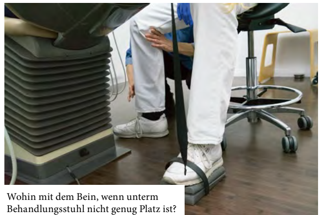
Wohin mit dem Bein, wenn unterm Behandlungsstuhl nicht genug Platz ist?

Die Grundidee ist, aus dem ewigen Kämpfen herauszukommen und stattdessen häufiger innezuhalten, um unnötige Verspannungen bemerken und lösen zu können. Sich ungünstige